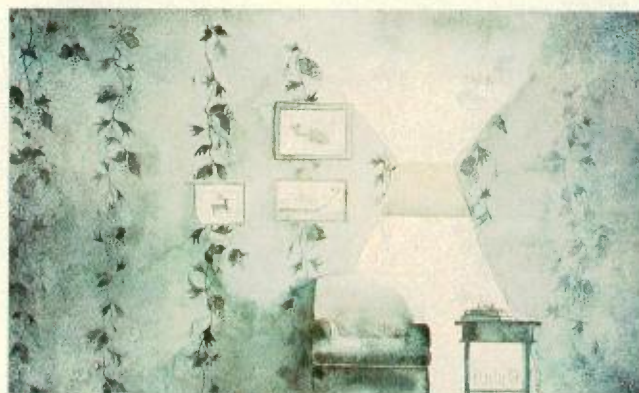
Os trabalhos expostos na GB Arte custam até CZ$ 18 mil